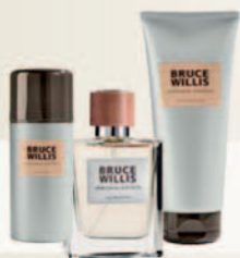
Set de fragancias Bruce Willis Personal Edition 2953