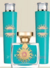
Set de fragancias Karolina by Karolina Kurkova 30103

La armonía en todos los niveles. ¿A quién no le gusta? Una fragancia sobre la piel debe ser más o menos intensa, dependiendo de la ocasión. Los geles de ducha y la loción para el cuerpo las opciones más discretas. Sin embargo, en combinación con un perfume, se convierten en una fuente vibrante de fragancia. Por este motivo todos nuestros perfumes están disponibles en nuestros sets de fragancias – ¡para una armonía extra con efecto de ahorro!